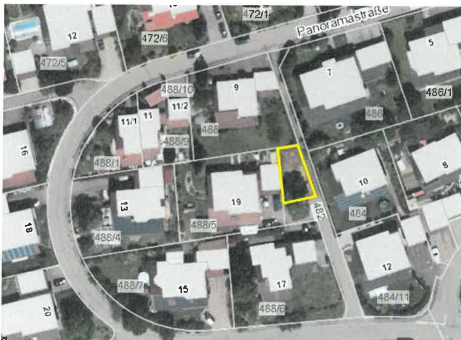
Abbildung 1: Übersichtslageplan, gelb: Geltungsbereich

Zur Überprüfung wurde am 23.02.2021 eine Begehung des Plangebiets vorgenommen und mittels Sichtkontrolle auf deren artenschutzrechtliche Relevanz gesichtet.