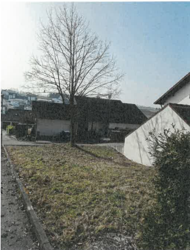
Abbildung 3: aus Norden, 23.02.2021