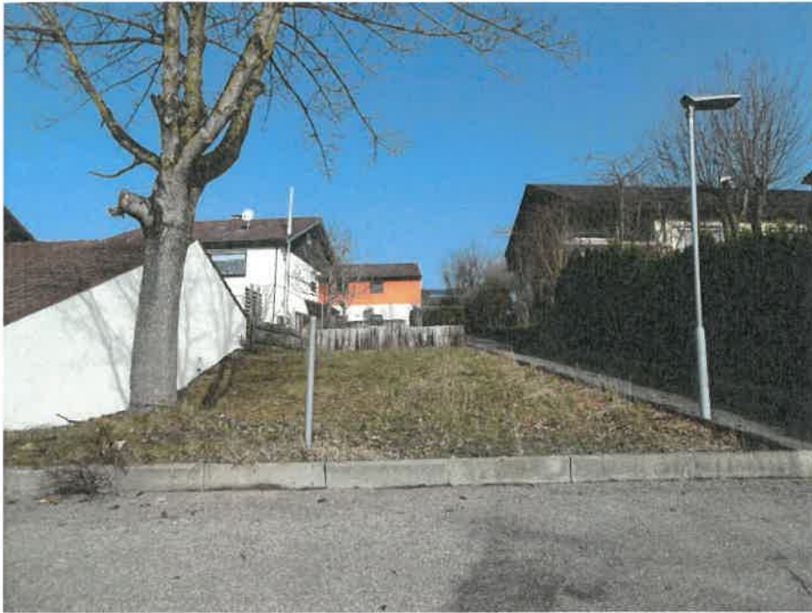
Abbildung 2: aus Süden, 23.02.2021