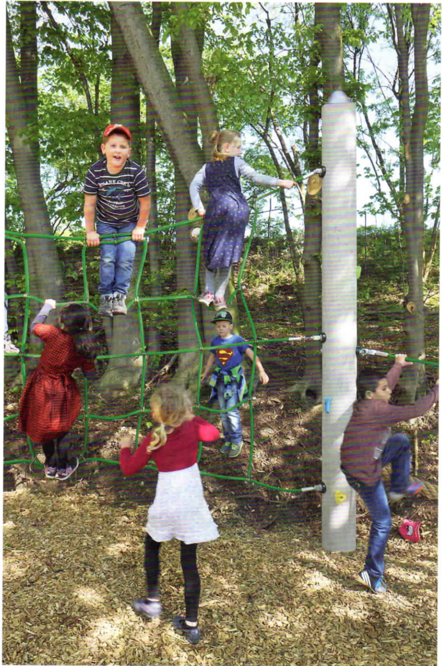
Die Standardfarbe der Seile ist grün.

Seile und Beschläge liegen im Sichtbereich und sind in bekannter Richter-Qualität im Seilparcours eingebaut.